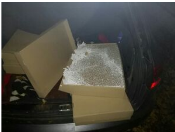
PSG w Jeleniej Górze

Postępowanie w sprawie naruszenia przepisów kodeksu karnego skarbowego prowadzą strażnicy graniczni z Jeleniej Góry. Zatrzymani mężczyźni, po przeprowadzeniu wstępnych czynności służbowych, zostali zwolnieni. Może im grozić wysoka grzywna, kara do trzech lat pozbawienia wolności lub obie te kary łącznie.