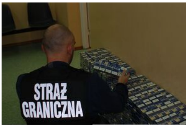
PSG w Tuplicach

29 października na drodze krajowej nr 2 w okolicach Świecka, polsko - niemiecki patrol zatrzymał do kontroli litewski samochód ciężarowy. Ładunkiem pojazdu były koła i opony samochodowe; funkcjonariusze potwierdzili, że pochodzą z kradzieży. Wartość skradzionych przedmiotów oszacowano na kwotę około 30 tysięcy euro. Kierowca ciężarówki, 29-letni obywatel Litwy, został zatrzymany, a następnie przekazany ślubickim policjantom, którzy prowadzić będą sprawę.