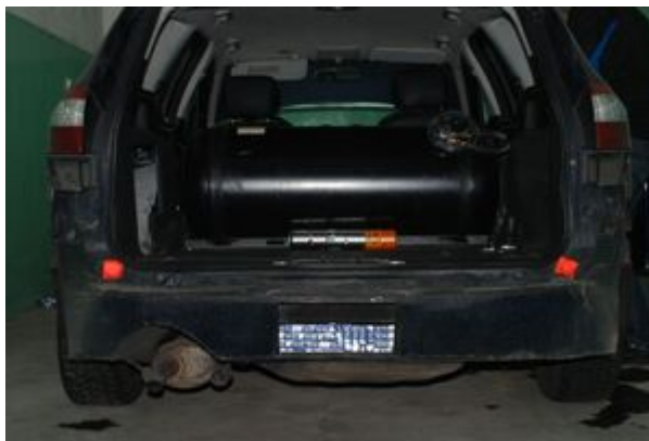
PSG w Tuplicach