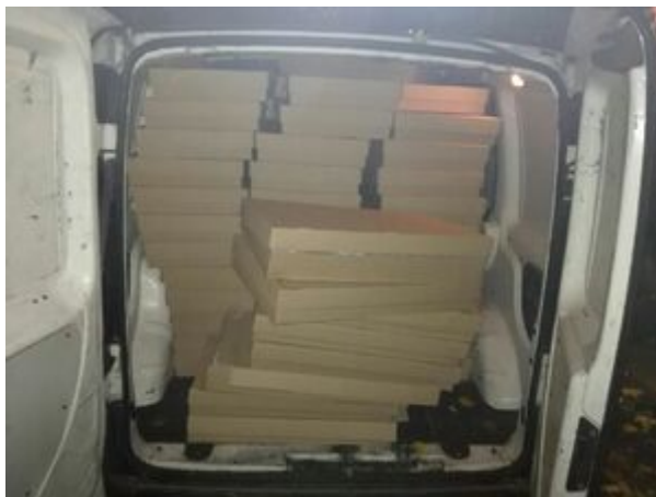
PSG w Jeleniej Górze

60 tysięcy sztuk papierosów z ukraińską akcyzą ujawnili 29 października funkcjonariusze SG z Tuplic. Na stacji benzynowej przy drodze krajowej nr 18 strażnicy skontrolowali samochód osobowy marki Ford Mondeo. Podejrzewając, że w pojeździe może znajdować się nielegalny towar, skierowano forda do Placówki SG w Tuplicach i przeszukano. Papierosy ukryte były w zderzakach samochodu, funkcjonariusze wyjęli ze skrytek 60 tysięcy sztuk papierosów. Wartość zabezpieczonego towaru wynosi 40 tysięcy złotych.