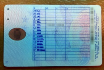
Zatrzymany dokument cudzoziemca