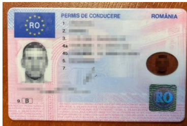
Zatrzymany dokument cudzoziemca

ograniczenia wolności albo pozbawienia wolności do lat 5. Natomiast za prowadzenie pojazdu mechanicznego, nie mając do tego uprawnień, grozi kara aresztu, ograniczenia wolności albo wysoka kara grzywny.