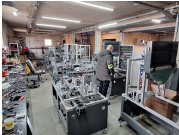
Uderzenie SG i KAS w zorganizowaną przestępczość akcyzową

Wśród podejrzanych były 2 kobiety oraz 16 mężczyzn w wieku od 21 do 66 lat. Za zarzucane im czyny grozi kara do 8 lat pozbawienia wolności.