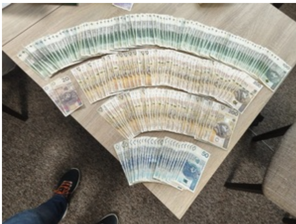
Uderzenie SG i KAS w zorganizowaną przestępczość akcyzową