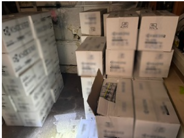
Uderzenie SG i KAS w zorganizowaną przestępczość akcyzową