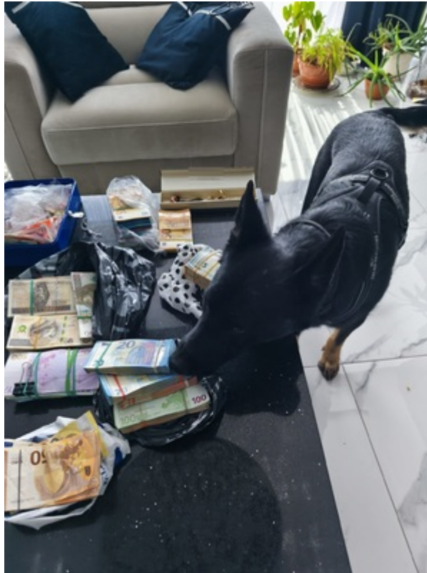
Uderzenie SG i KAS w zorganizowaną przestępczość akcyzową