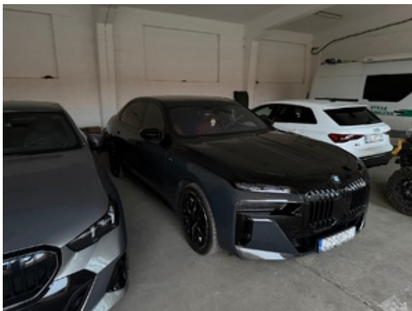
Uderzenie SG i KAS w zorganizowaną przestępczość akcyzową