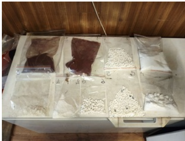
Uderzenie SG i KAS w zorganizowaną przestępczość akcyzową