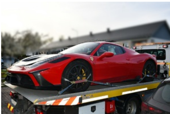
Uderzenie SG i KAS w zorganizowaną przestępczość akcyzową