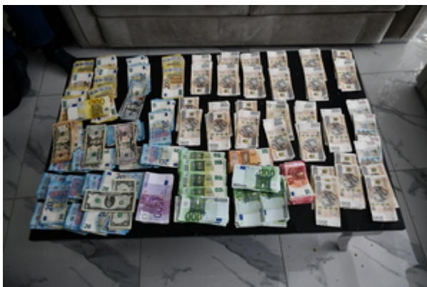
Uderzenie SG i KAS w zorganizowaną przestępczość akcyzową