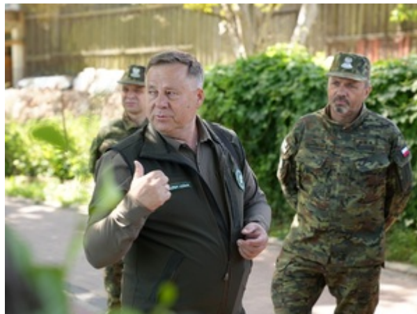
Na szlaku dawnej polsko-niemieckiej granicy