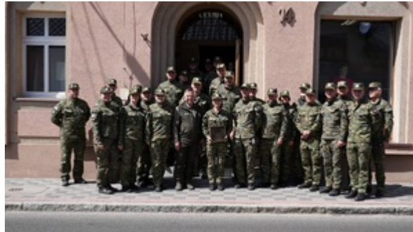
Na szlaku dawnej polsko-niemieckiej granicy