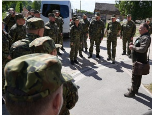
Na szlaku dawnej polsko-niemieckiej granicy