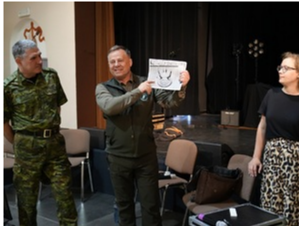
Na szlaku dawnej polsko-niemieckiej granicy