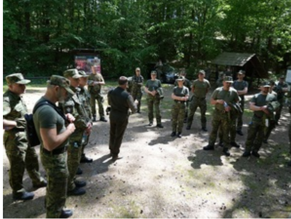
Na szlaku dawnej polsko-niemieckiej granicy