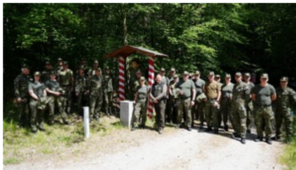
Na szlaku dawnej polsko-niemieckiej granicy