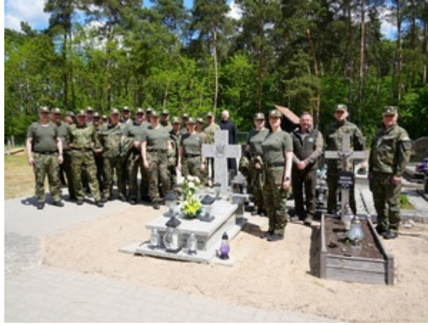
Na szlaku dawnej polsko-niemieckiej granicy