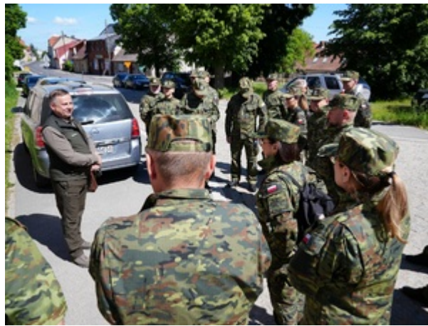
Na szlaku dawnej polsko-niemieckiej granicy