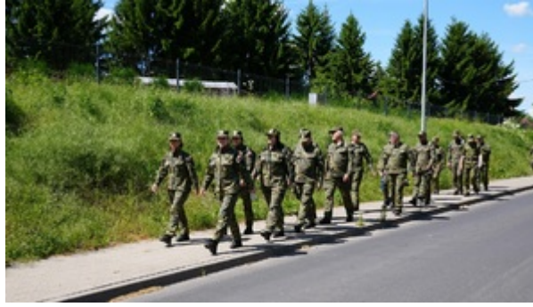
Na szlaku dawnej polsko-niemieckiej granicy